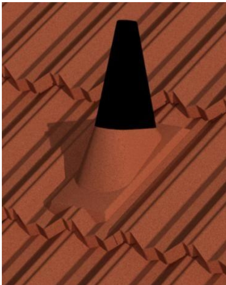
Montáž anténního prostupu

Anténní vstup je tvarovka, která má stejně jako sanitní a větrací šablona podobu dvou "vln" střešní šablony a nízkého komínku s gumovým rukávem a zdrhovadlem. Přibíjí se mezi dvě střešní šablony čtyřmi hřebíky. Maximální průměr anténního stožáru, který lze vstupem provléci, činí 60 mm.