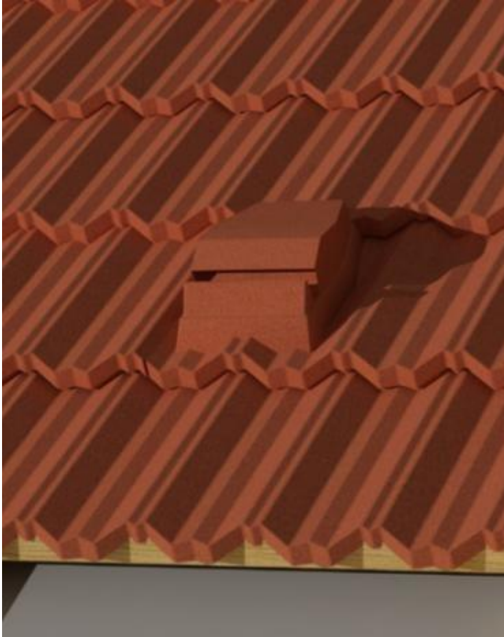
Montáž větrací šablony

Větrací šablona je tvarovka, která má stejně jako sanitní šablona podobu dvou "vln" střešní šablony a nízkého komínku s otvorem v přední části a větrací kapacitou 75 cm 2 . Přibíjí se mezi dvě střešní šablony čtyřmi hřebíky.