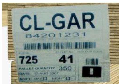
Papírový štítek s číslem výrobní šarže na Označení výrobní šarže na spodní straně paletě

Číslo výrobní šarže střešních šablon je uvedeno na papírovém štítku přisponkovaném na hraně palety (viz obrázek). Dále je uvedeno na spodní straně šablony (viz obrázek). Doporučujeme, aby na jedné střeše byly použity střešní šablony ze stejné výrobní šarže. Není-li možné toto doporučení dodržet, je nutné používat šablony různých výrobních šarží pouze na vzájemně oddělených částech střechy (např. na každé úbočí sedlové střechy jednu šarži, na úžlabím oddělený arkýř jinou šarží než na zbytek střechy apod. Dodržením tohoto doporučení nedojde ke vzniku nežádoucích odlišností v barevných odstínech střešních šablon.