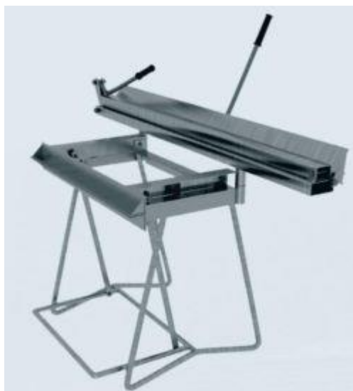
Ohýbačka střešních šablon

K montáži střešních systémů GERARD® můžete dále používat nastřelovačky hřebíků PASLODE IM350CT a DUOFAST CNP65Y v kombinaci se žárově pozinkovanými kroužkovými hřebíky PASLODE/DUOFAST HDG 2,5x50. Používat nastřelovačku hřebíků nicméně doporučujeme až poté, co si montáž střešních šablon vyzkoušíte ručně. Nedoporučujeme nastřelovat střešní šablony hřebíkovačkou v teplotách pod 0°C z důvodu snížené elasticity akrylové pryskyřice fixující kamenný posyp k povrchu plechu.