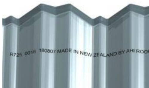
Označení výrobní šarže na spodní straně šablony