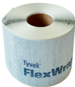
Délka: 23 m Šířka: 15 cm

Flexibilní vysoce výkonné pásy pro vzduchotěsné a vodotěsné utěsnění prostupů ve střeše, stropu a stěnách