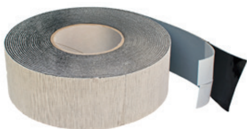
Délka: 10 m Šířka: 60 mm